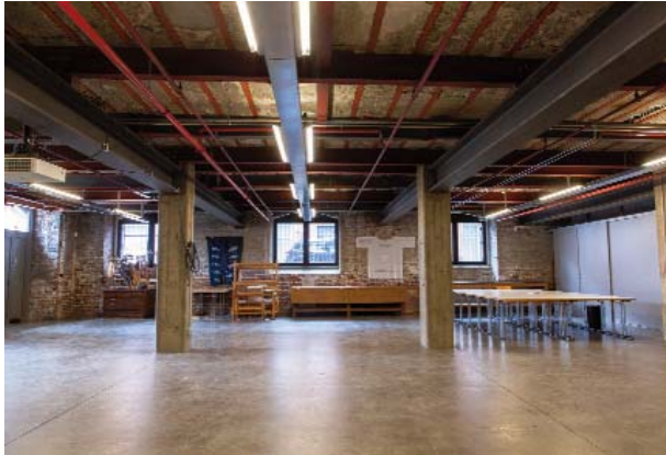
Blick ins Baumwolllager. Hier findet unsere Mitgliederversammlung statt