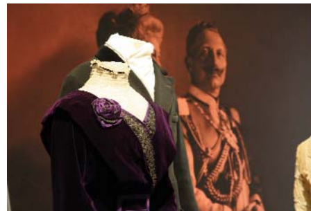
Bilder zur Ausstellung